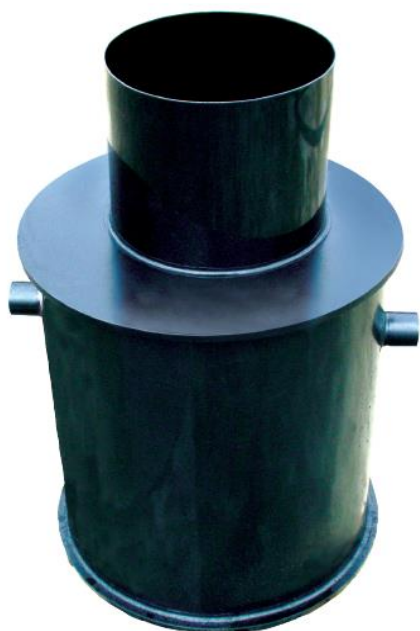
Afbeelding zonder deksel